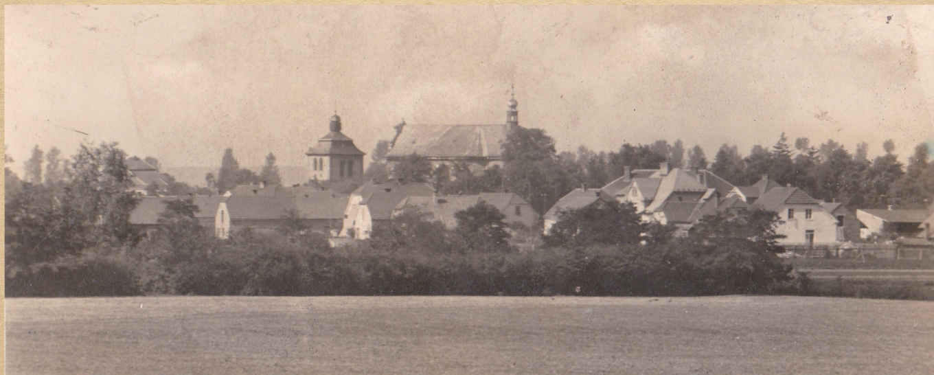
Jižní pohled na Kostomlaty